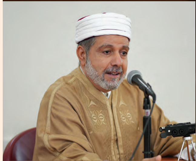
أ.د. نور الدين الخادمي