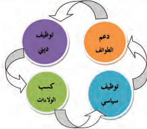
المخطط التالي: يبرز الاستراتيجية الإيرانية في التوظيف السياسي للأقليات في الوطن العربي

من خلال الجدول يظهر أن هناك شبه توازن بين أعداء إيران وحلفائها في المنطقة العربية إلا أن الاختلاف يكمن في القدرات والإمكانات فالدول الحليفة جلها خرجت أو لا زالت تعاني من تبعات الحروب المتتالية التي تلعب فيها إيران دوراً رئيسياً فعدم الاستقرار السياسي والأمني يحتم على هذه الدول تكييف سيادتها بما يجنبها مجابهة القوة الإيرانية.